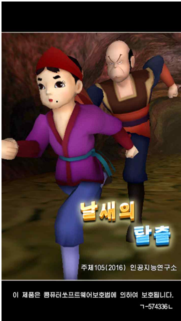
<사진5> 스마트폰용 게임 날새의 탈출 모습

의 효율성과 정밀도를 높이는 시도를 했지만 이를 더 개선하기 위해 인공신경망(Artificial Neural Network) 기술을 적용했다는 것이다.