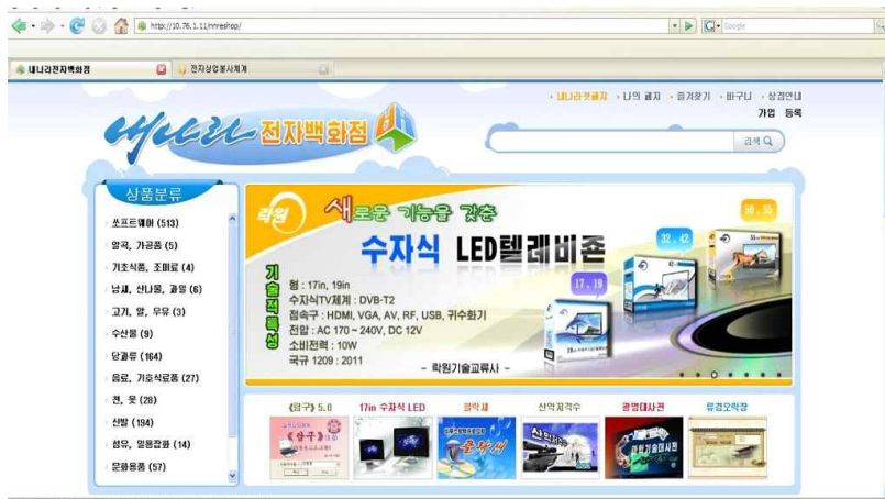
<사진8> 내나라전자백화점 모습

북한은 폐쇄 사회로 인터넷 사용이 철저히 통제되고 있다. 인터넷 활용은 정보수집이나 제한적인 목적에서만 허용되고 있는 것으로 알려졌다. 이에 따라 인트라넷이 대안으로 발전하고 있다. 2012년 10월 진행된 제23차 전국프로그램경연 및 전시회에 내나라전자상점이 처음으로 소개됐다. 내나라전자상점은 북한 인트라넷에 만들어진 전자상점으로 수 백 가지 상품을 판매하고 있다. 북한은 또 2017년 초 전자결제카드로 운영되는 전자상업봉사체제인 옥류도 만들어 운영하고 있다. 북한 대외선전매체 조선의오늘은 2017년 6월 24일 전자상업 홈페이지 만물상이 인기를 끌고 있다고 보도했다. 만물상은 북한 내 생산기업소들과 상점들이 자기 단위의 제품, 상품에 대한 정보를 사이트에 필요할 때마다 올릴 수 있고 구매자들도 국가컴퓨터망과 휴대폰(손전화) 자료통신망에 가입해 열람할 수 있다고 설명했다.