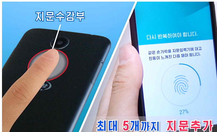
<사진2> 아리랑161의 지문인식 기능

최근 북한이 생산한 스마트폰을 분석해보면 관련된 기술 현황을 조금이라도 알 수 있다. 2016년 생산된 아리랑151은 쿼드코어 1.3Ghz CPU와 ROM 32GB, RAM 2GB의 부품이 장착됐다. 운영체제(OS)는 ‘안드로이드 4.4.2 킷캣’이 적용됐고 무게 148g이다. 5인치 접촉화면은 1280x720 해상도를 제공하고 카메라는 자동초점 기능, 레드플래시를 가진 13메가픽셀 화소 성능을 제공한다. 배터리는 2500mAh, 통화시간은 7~8시간, 대기시간은 150시간이다. 아리랑152는 쿼드코어 1.3GHz CPU와 ROM 16GB, RAM 1GB 사양의 제품이다. OS는 안드로이드 4.4.2를 적용했으며 무게는 125g이고 4인치 접촉화면에 800X480 해상도를 제공한다. 아리랑151, 152는 2014년 3월 출시된 삼성 갤럭시S4, 갤럭시S5와 사양이 비슷하다. 갤럭시S4에는 안드로이드 4.2.2 젤리빈이 갤럭시S5에는 안드로이드 4.4.2 킷캣이 적용됐다. 2017년 여름 북한은 아리랑161을 선보였다. 아리랑161은 지문인식 기능이 적용된 것이 특징이다. 지문인식 기능은 2013년 9월 아이폰5S에, 2014년 3월 출시된 갤럭시S5에 탑재된 바 있다.