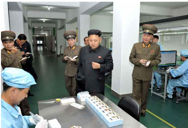
<사진1> 5월11일공장을 둘러보고 있는 김정은 위원장 모습

북한은 아리랑, 진달래, 평양 등 다양한 브랜드의 스마트폰을 생산하고 있다. 김정은 위원장은 2013년 8월 11일 북한 스마트폰 아리랑 생산 공장인 5월11일공장(공장 이름이 5월11일 공장임)을 방문했다. 김정일이 과거 중국 방문 시 중국 전자업체를 방문한 적은 있지만 북한 최고 지도자가 스마트폰 공장을 직접 방문한 것은 이례적인 일이다.