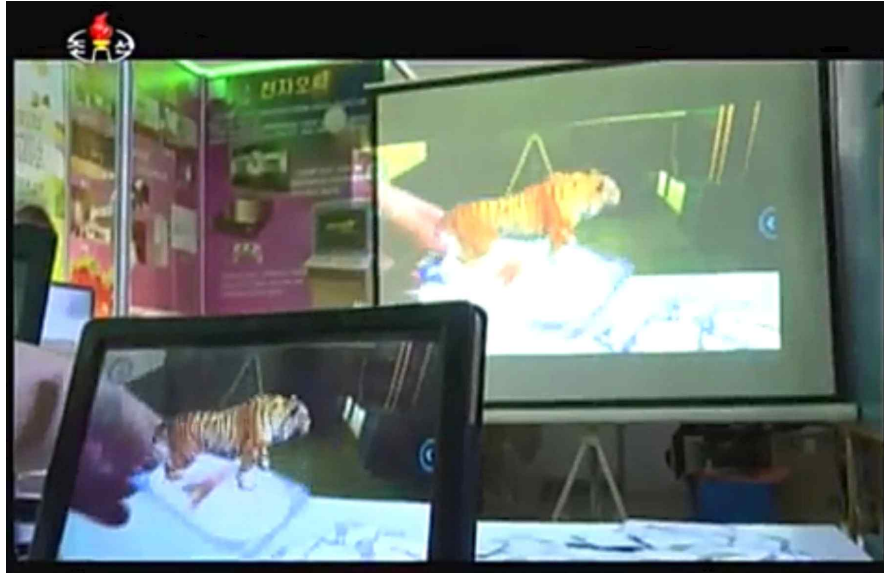
<사진7> 북한이 개발한 AR 교육 프로그램 신비경 모습

북한은 차세대 통신, 보안 기술로 알려진 양자암호통신 관련 연구도 진행하고 있다. 2017년 1월 북한 선전매체 서광은 북한 과학자들이 도청과 해킹을 원리적으로 불가능하게 하는 첨단통신기술을 개발하는데 성공했다고 밝혔다. 북한은 양자암호통신기로 문서, 화상 자료 등을 전송하는 실험에 성공했다고 주장했다. 또 연구원들이 선행 연구 내용과 달리 한 개의 빛 양자 검출기만을 사용해 제작 원가가 낮으면서 오류를 줄인 방식을 개발했다고 설명했다.