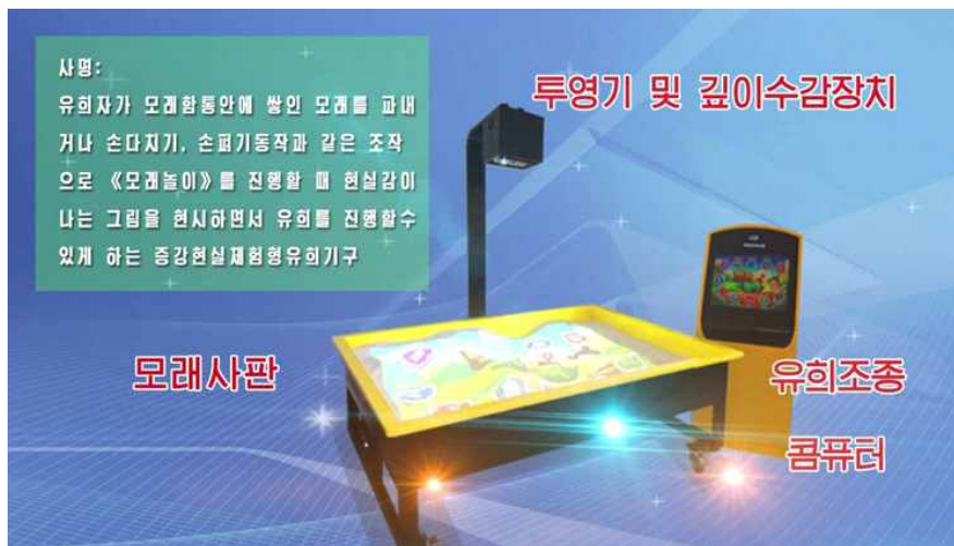
<사진6> 북한이 개발한 증강현실 도구 모래놀이 모습

인공지능 기술 뿐 아니라 북한은 증강현실(AR), 양자암호통신 등에 관한 연구도 진행하고 있다. 2017년 9월 북한 선전매체 조선의오늘은 김일성종합대학 첨단과학연구원 정보기술연구소가 지능유희사판 '모래놀이'를 개발했다고 보도했다. 이 기기는 모래판에 증강현실 기술을 적용한 것이 특징이다. 국내에도 이와 유사한 AR 교육, 놀이기구가 소개된 적이 있다.